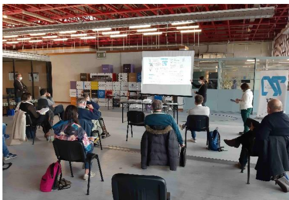
Mise en contexte par le SPW et la MU du Hainaut